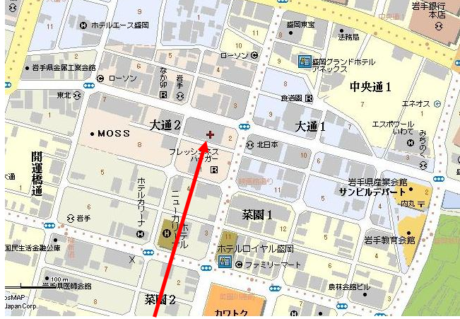
所在地:盛岡市大通 2-2-16 アキヤマビル 2F