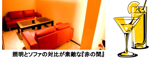
照明とソファの対比が素敵な『赤の間』