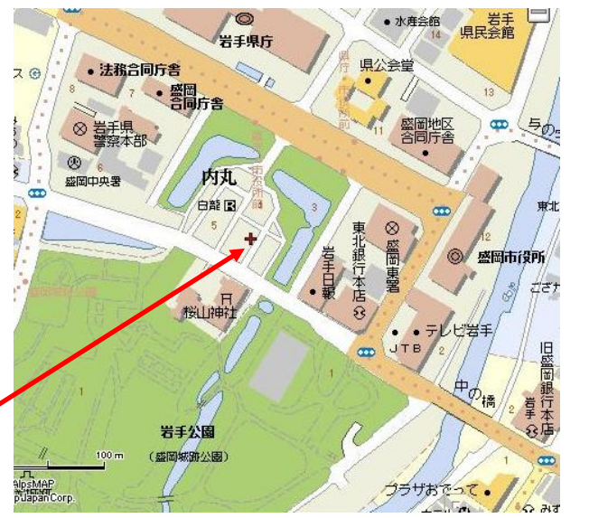
所在地:盛岡市内丸 1-42

緑の相談室様では、岩手県が推進する「自然と共生、環境を基調とする社会」を実現するため、緑化に関する色んな相談事への対応や、自然資源を活用したまちづくりの推進のため、岩手公園などの管理受託等の活動をされています。