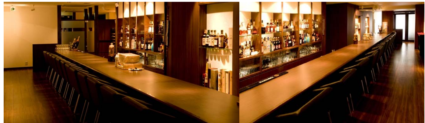
なんと一度に 12人 が座れる！ 盛岡の新名所(?)超 ロングカウンターでゆっくりおくらして下さい

オーナーこだわりのカウンター、ぜひソファに身を沈めて、オーナーの微笑みと共に静かに供されるカクテルの演出に、酔いしれてみてはいかがでしょうか？