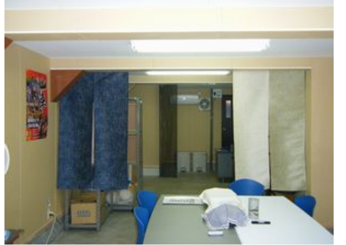
シンプルだけど丁寧に仕上げました

そんな、みどりの守り人のみなさまが集う事務所の改装を依頼され、がぜん張り切る理創メンバー。