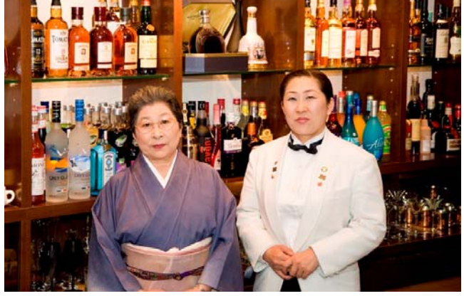
とても優しいオーナー様とお母様です