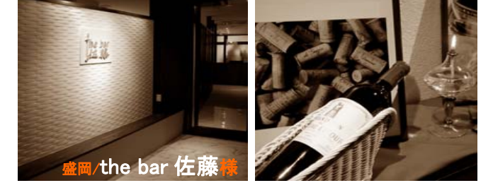
シンプルで優雅なエントランス シャワー・ラトゥールもさりげなく

とても優しく女性らしい方なのですが、ひとたび白いブレザーに袖を通すと、キリッとカッコいいバーテンダーさんに変身してしまうのです。(素敵です♡)